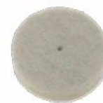
Feltro a disco pz 1