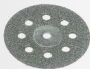
Disco diamantato pz 1