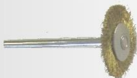
Spazzola radiale Ottone pz 1